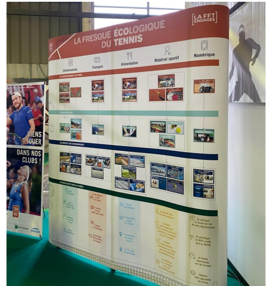
Tournoi des Petits As, janvier 2023

+ Possibilité d'animer le stand via des mécanismes de quiz par exemple.